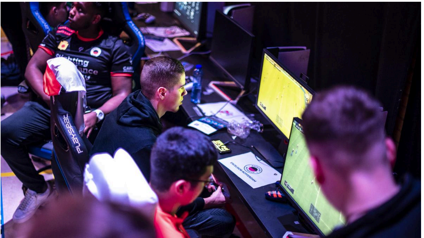
Professionele e-sporters spelen zich warm achter hun spelcomputer.

26-10-22, 19:45 | update: 27-10-22, 10:26