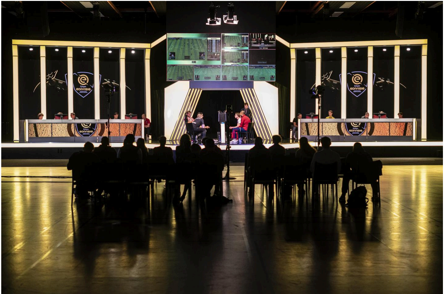
Het Rabo Esports Stadium is iedere dinsdag het podium voor de KPN eDivisie.