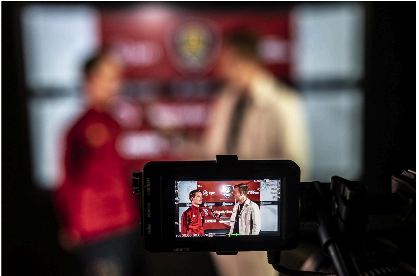
Na de wedstrijd worden de gamers geïnterviewd over hun prestatie achter de spelcomputer.

Hij wist vandaag te winnen van Vitesse. Over twee wedstrijden werd het 4-2, waardoor de gamers uit Volendam nu op een keurige vierde plaats staan. Dat is een stuk hoger dan de voetballers van de club, die de laatste plek in de Eredivisie bekleden om dit moment, maar dat maakt Collin niet heel veel uit: „Ik ben voor Feyenoord, daar heb ik nooit een geheim van gemaakt.”